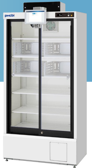
※PHC株式会社製 薬用冷蔵ショーケース MPR-S500H-PJにシステムを設置した状態

NOVUMN〈ノヴァム〉は、医薬品の需要情報をタイムリーに連携することで、安定的 & 確実な流通管理に貢献する個別化医療支援のプラットフォームサービスです。